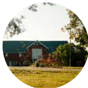
Landbrukets egen nedbygging