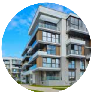
Utbygging til bolig og næring