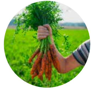
Lite kunnskap om landbruksnæringen