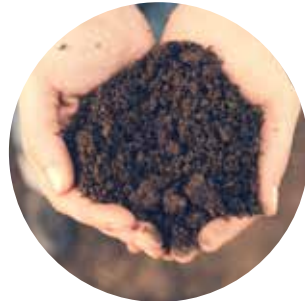
Lite kunnskap om viktigheten av matjord