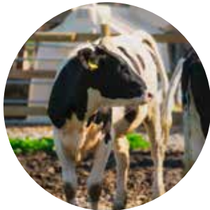
Dårlig økonomi i landbruket