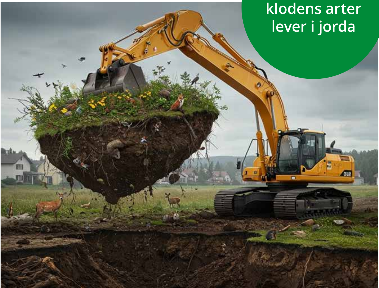
Bildet er laget ved hjelp av KI.

Over 50 % av klodens arter lever i jorda