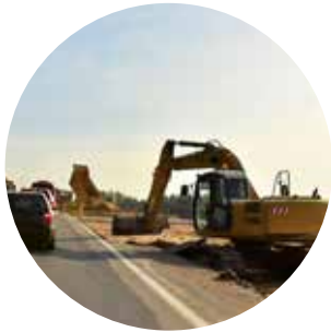
Utbygging til vei og bane