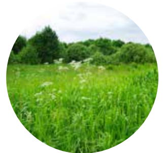
Holde matjorda i drift

Mangel på klare mål, tilstrekkelig innsats og støttespillere gjør det utfordrende å bevare matjord. Vi kan ikke forvente at Norges økonomiske styrke alene vil løse disse problemene.