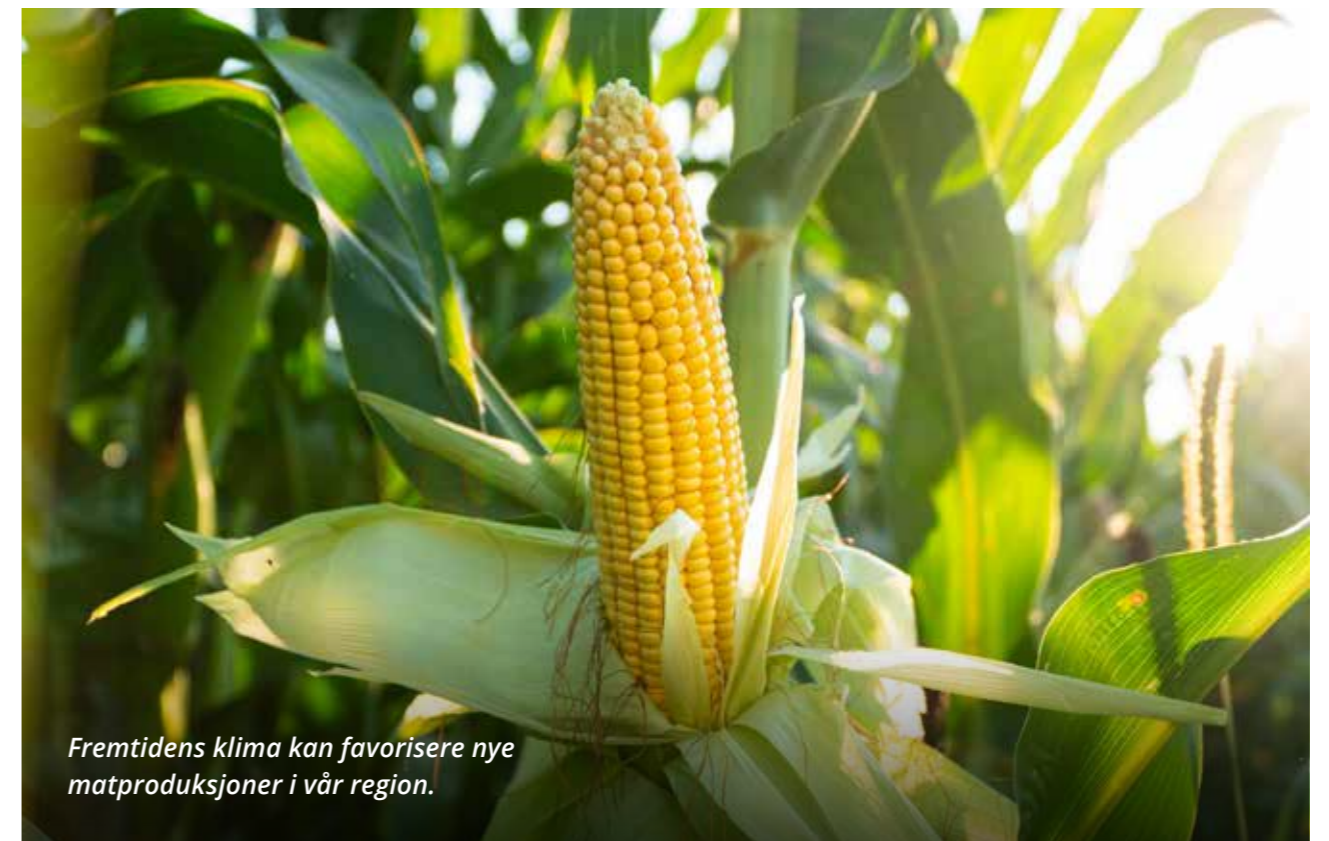
Fremtidens klima kan favorisere nye matproduksjoner i vår region.