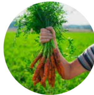
Lite kunnskap om landbruksnæringen