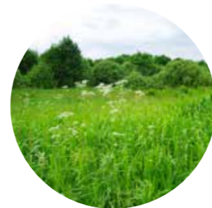
Holde matjorda i drift